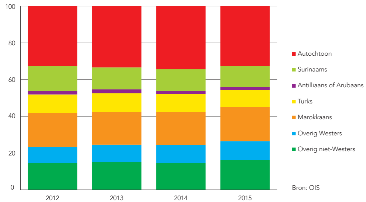
Figuur 29 Alle Amsterdamse 16-jarigen naar herkomst (2012-2015)