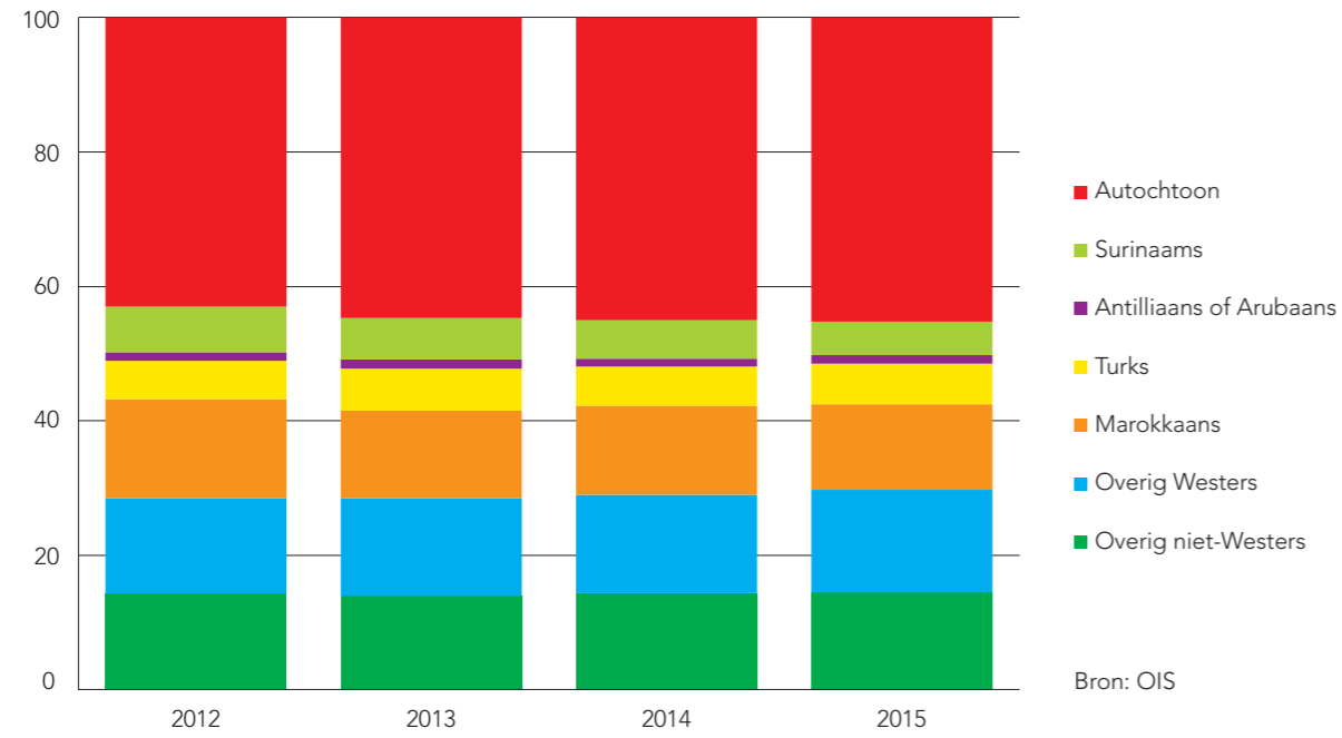
Figuur 26 Alle Amsterdamse 5-jarigen naar herkomst (2012-2015)